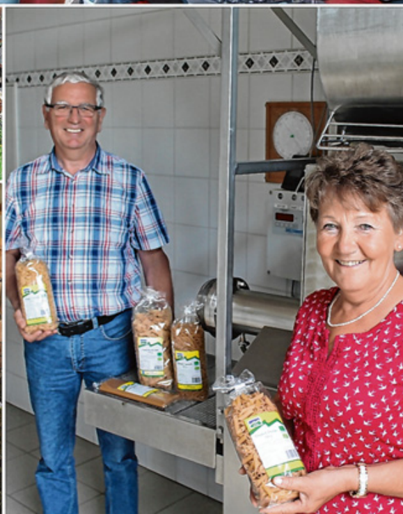
In über 20 Teilen der Landwirtschaftsserie zeigte die Buchloer Zeitung in Artikeln und Bildern, wie breit die Landwirtschaft im nördlichen Ostallgäu aufgestellt ist und welche Methoden die Bauern entwickelt haben, um trotz Wandel und kriselnder Branche obenauf zu bleiben.

die Nährstoffauswaschung. Rückläufig war auch die Weidehaltung, was mit der Zunahme der Herdengröße und des Verkehrs zusammenhängt. Um hier etwas gegenzusteuern, habe ich die Weideprämie eingeführt.